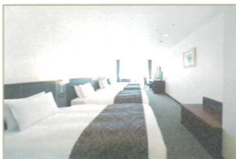
37㎡ ラージツインルーム [Large twin room]