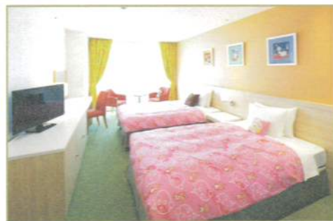
26㎡ たわわちゃんルーム [TAWAWA-chan room]