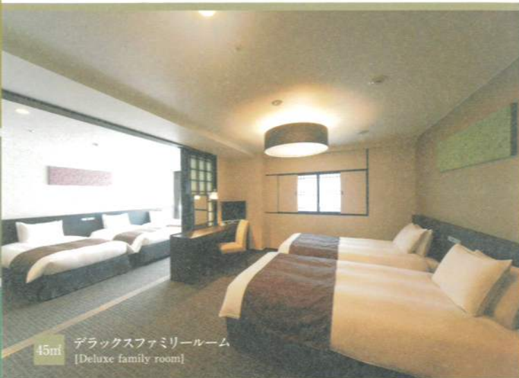
45㎡ デラックスファミリールーム [Deluxe family room]