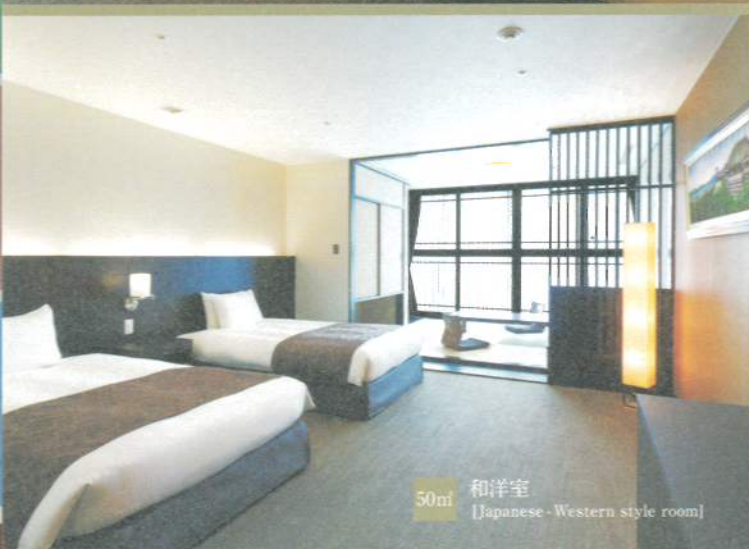
50㎡ 和洋室 [Japanese-Western style room]