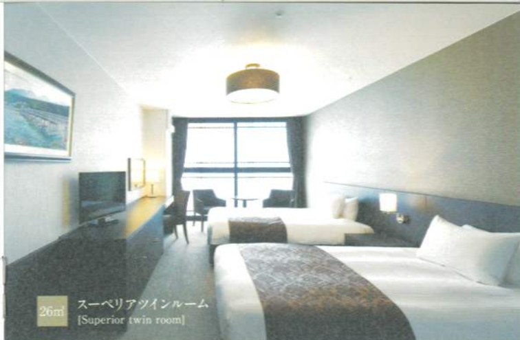
26㎡ スーベリアツインルーム [Superior twin room]

Spend time relaxing in our rooms where Japanese and modern themes are beautifully blended and you are welcomed with Kyoto-style hospitality. Assorted room types are available from single to family use (up to 7 guests).