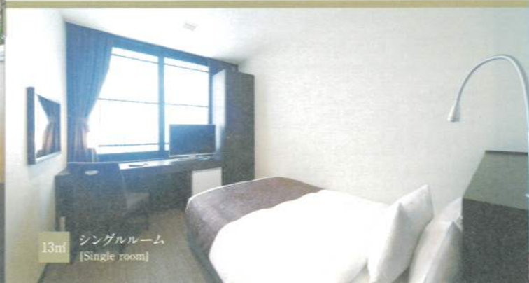
13㎡ シングルルーム [Single room]